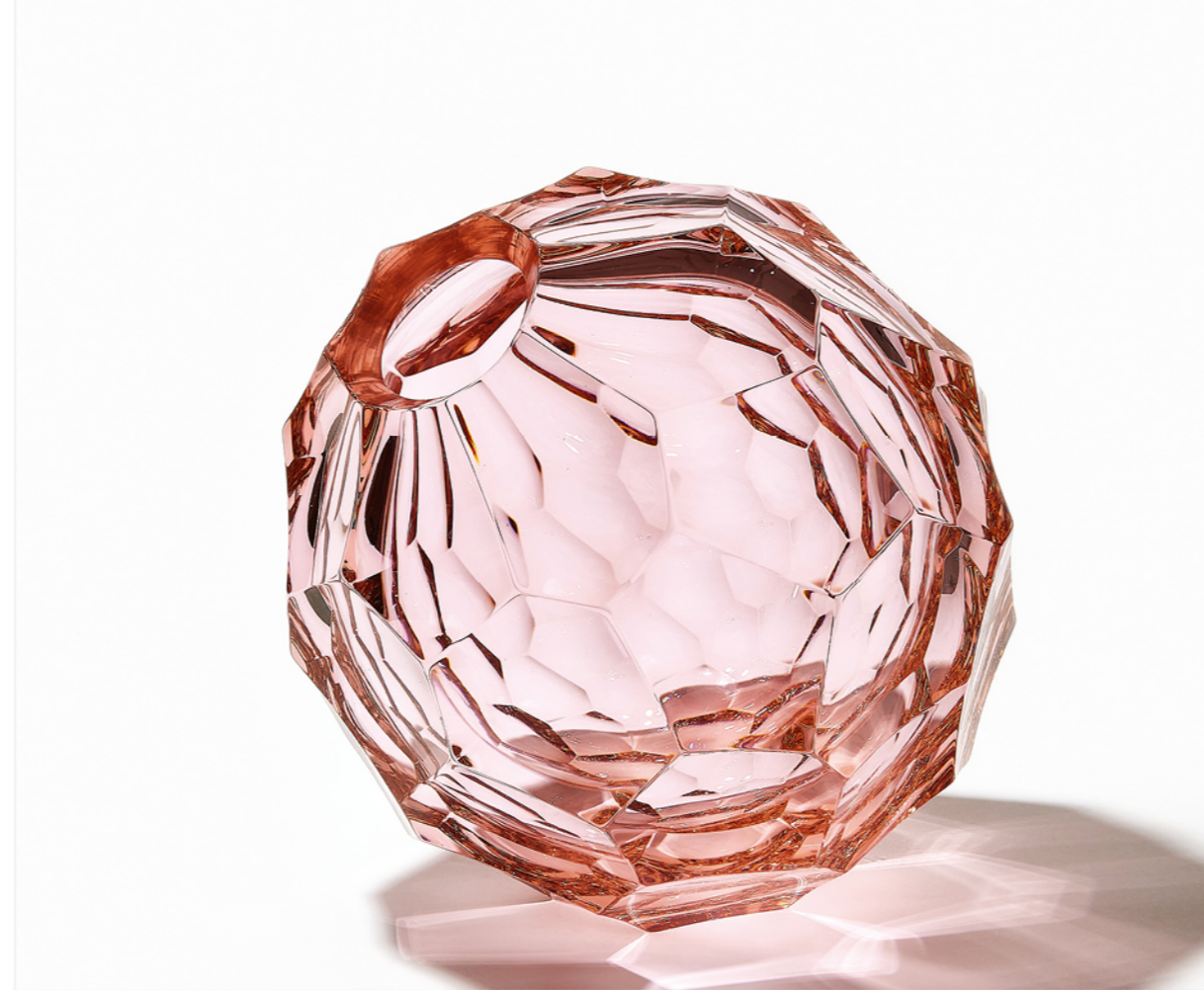
VOID_#24 (rose gold) | 2024 | Ø25 cm | blown, coldworked and polished glass

갤러리스클로 대표 김효정 | curated and written by KIM Hyojung, director of Gallery Sklo